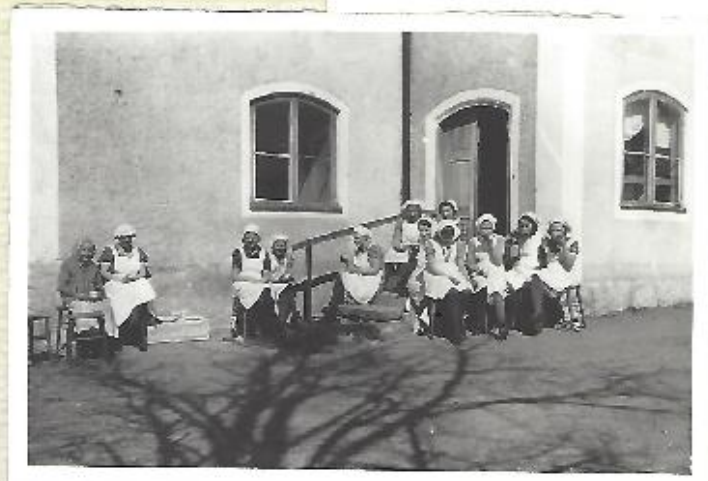
Skolköket: omkr. 1939?