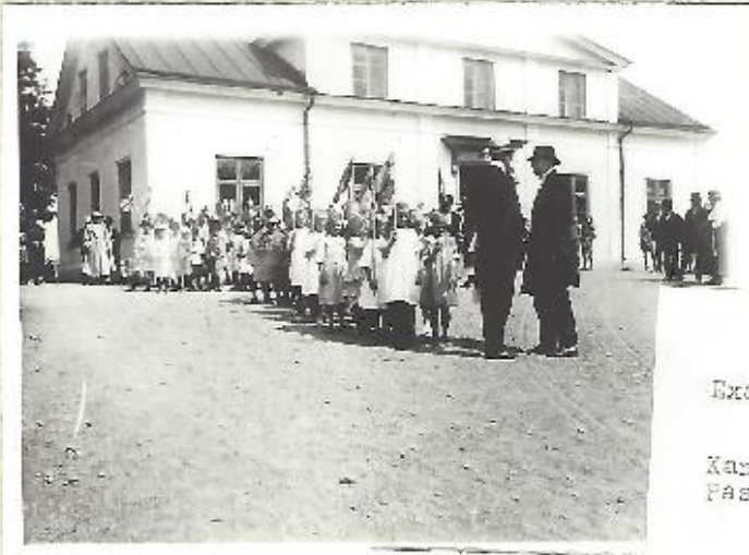
Examens foton - 1923?